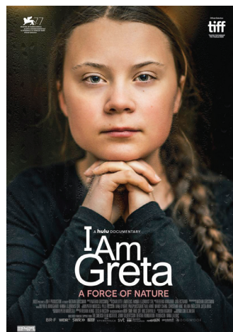
YO SOY GRETA THUNBERG 5 NOVIEMBRE