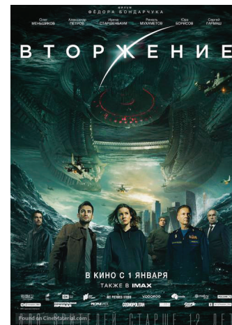
INVASIÓN: EL FIN DE LOS TIEMPOS 26 NOVIEMBRE