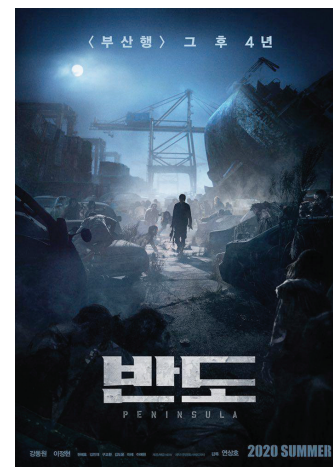
ESTACIÓN ZOMBIE 2: PENÍNSULA 5 NOVIEMBRE